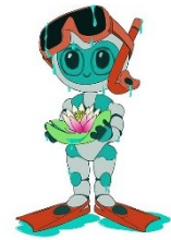
Nénubot, la mascotte du projet

Cet inventaire atteint ses limites pour des raisons techniques et de sécurité. Il pourrait être amélioré grâce à un robot photographe subaquatique. Le projet qui fait suite à ce film est de concevoir un petit robot assez bon marché, stable et facile à contrôler, pour photographier sous l'eau sans perturber le milieu.